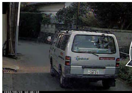
動いている車のナンバープレートもこんなに はっきりと映すことが出来ます。

高性能赤外線暗視カメラを採用しているため、真っ暗な屋外で光源が存在していなくても鮮明な動画が撮影可能です。