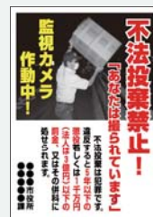
■「あなたは撮られています」看板