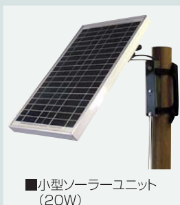
■小型ソーラーユニット (20W)